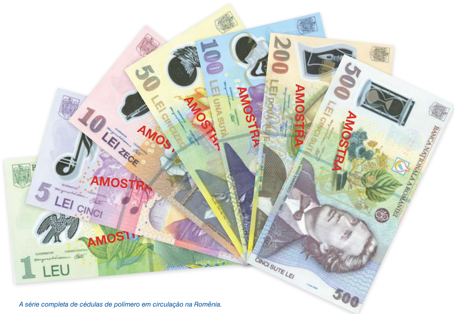
A série completa de cédulas de polímero em circulação na Romênia.

A primeira cédula de polímero Guardian ® foi emitida na Romênia em 1999. A cédula de 2.000 lei foi emitida em agosto de 1999, para comemorar o eclipse solar de 11 de agosto daquele ano, com a trajetória do eclipse solar sobre o território romeno representada na cédula.