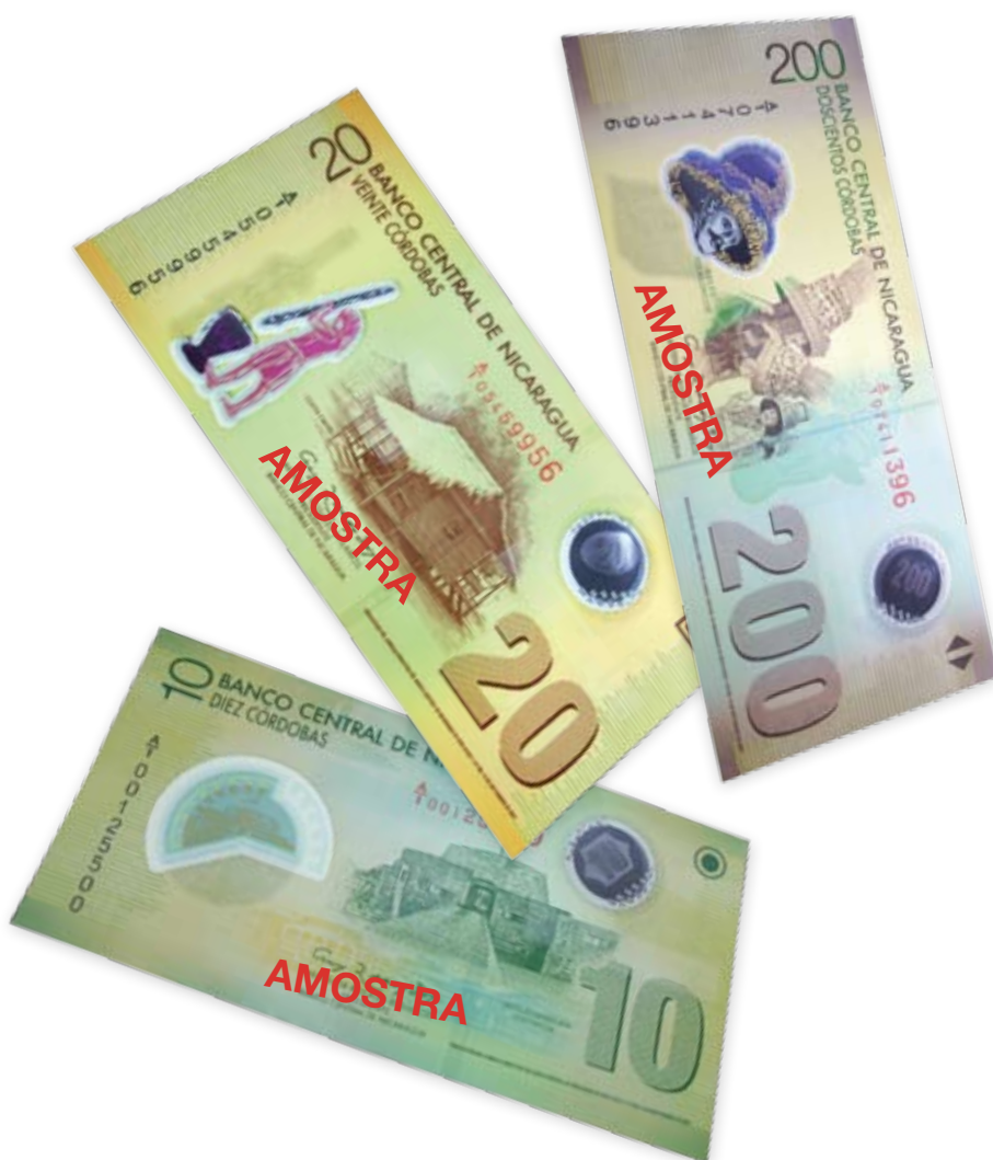
Novas cédulas de polímero de 10, 20 e 200 córdobas.

O design da cédula de 20 córdobas apresenta a imagem de uma casa típica da costa caribenha da Nicarágua na frente e um grupo de dança no verso. O tamanho da cédula é 136 x 67 mm.